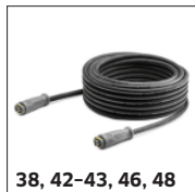
38, 42-43, 46, 48