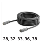
28, 32-33, 36, 38